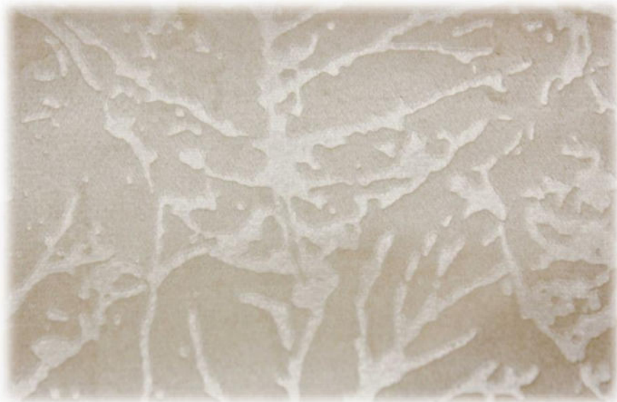
Мебельная ткань DIVA 04