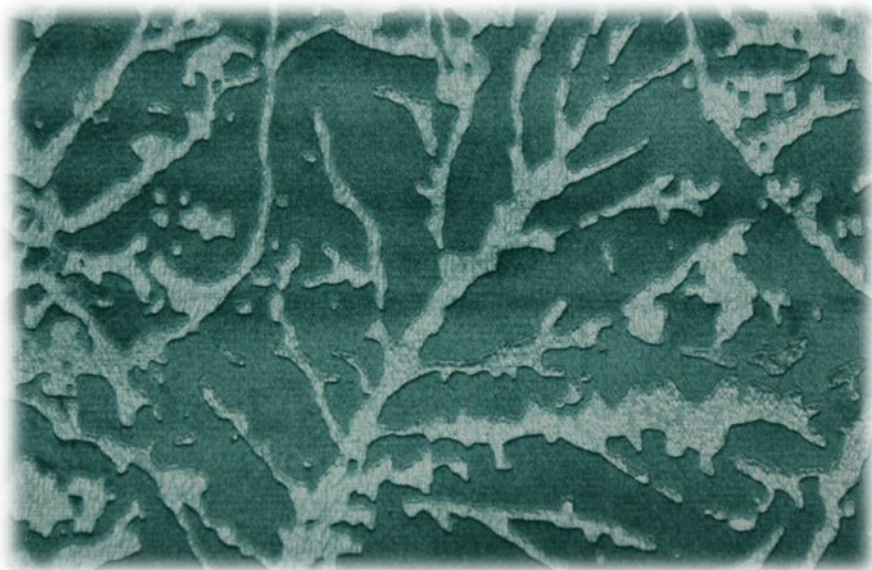
Мебельная ткань DIVA 20