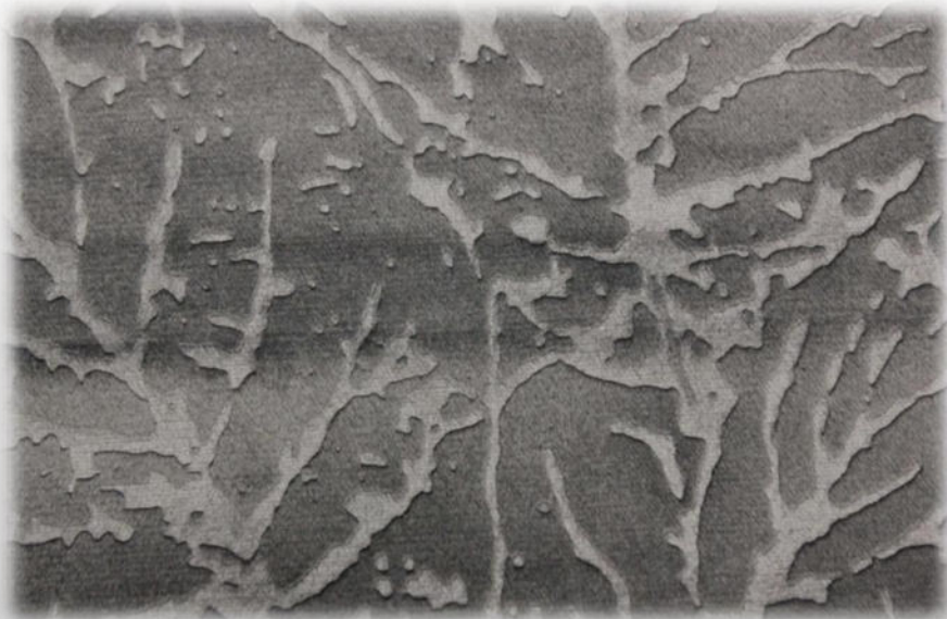
Мебельная ткань DIVA 32