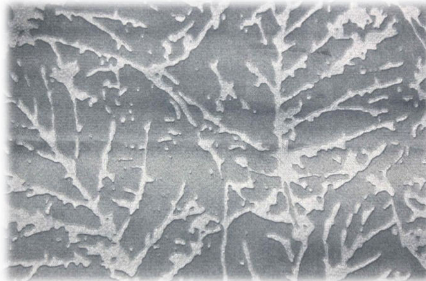
Мебельная ткань DIVA 12