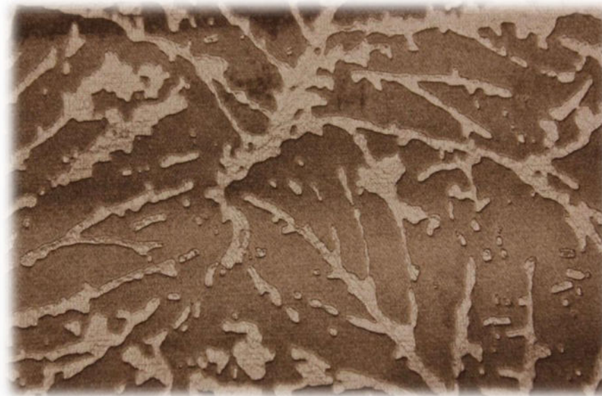
Мебельная ткань DIVA 23