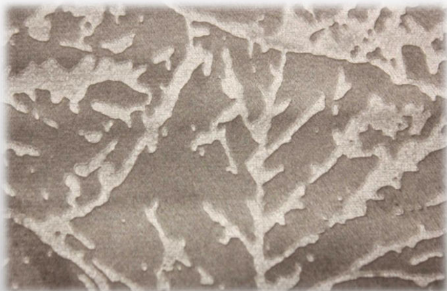
Мебельная ткань DIVA 08